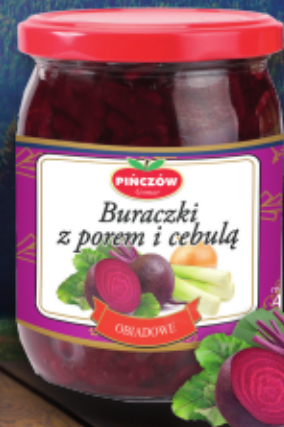
buraczki z porem i cebulą