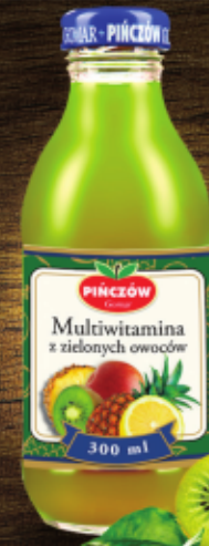
Napój Multiwitamina zielonych owoców