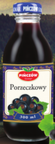
Nektar z czarnej porzeczki