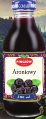
Nektar z aronii