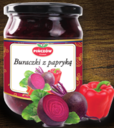
buraczki z papryką