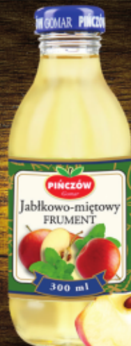
Napój jabłkowo-miętowy „Frument”